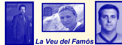
La Veu del Famos